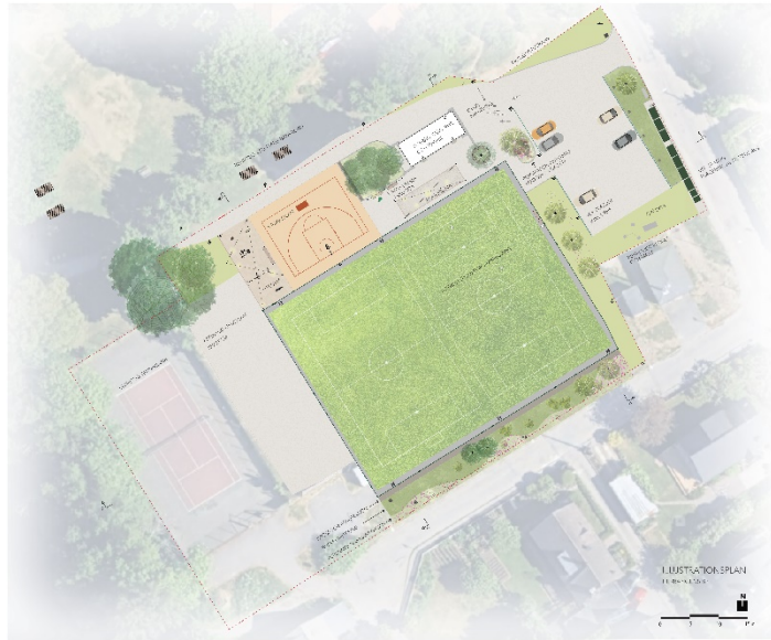
Illustration över planerad utformning av Herrängens BP.

med måtten 30 x 20 meter samt tillhörande säkerhetszoner samt kompletteras med stängsel och belysning. Konstgräset kommer att anläggas som granulatfritt.