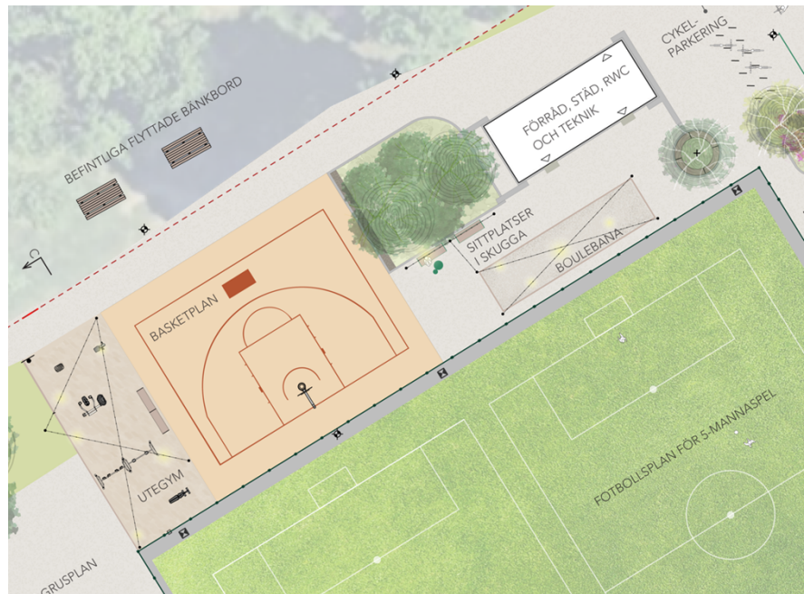
Inzoomning i illustration över spontanidrottsytor och servicebyggnad.