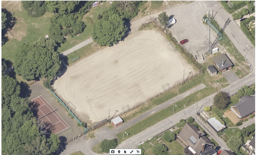
Flygfoto över Herrängens BP, 2023.

Herrängens BP utgörs idag av en 7-spelsplan med grusunderlag, omgiven av stängsel och utrustad med belysning. Anläggningen är belägen på Segeltorpsvägen 37 i Älvsjö.